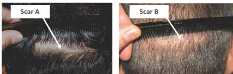
Scar A – Cicatrice non-tricofitica

L'obiettivo della tecnica di sutura 'Tricho' è far sì che i capelli crescano eventualmente attraverso l'incisione in modo da ridurre drasticamente la visibilità della cicatrice. La tecnica di sutura tricofitica può essere utilizzata in pazienti che si sono sottoposti a precedenti chirurgie strip per rendere la loro cicatrice esteticamente accettabile. Questa tecnica è ora utilizzata anche per pazienti che per la prima volta si sottopongono a chirurgia. È specialmente indicata per trattamenti correttivi o ricostruttivi. Per pazienti che amano un taglio corto di capelli questa tecnica offre un'alternativa valida alla Follicular Unit Extraction (FUE).